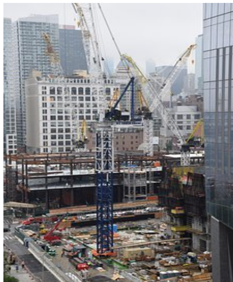
mercado de varejo.

O índice, calculado pelo CEEA, é usado para observar tendências de inflação do material de construção, na cidade de Belo Horizonte, no